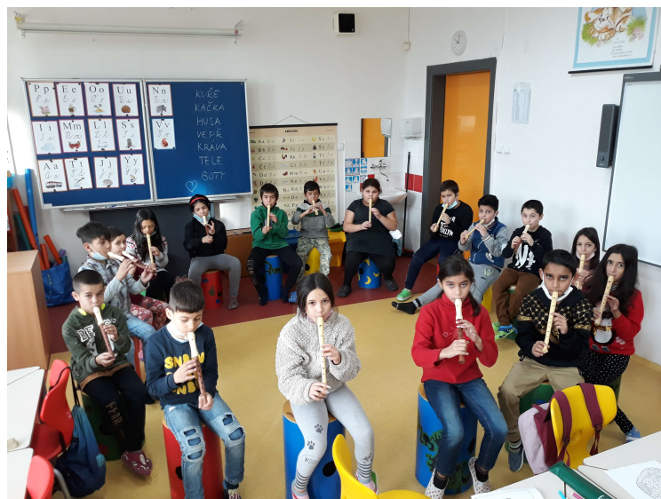
žáci 1.,2. třídy při nácviu

Zahráli jsme vám v tělocvičně na Společném setkání tříd a můžete se na nás těšit i na Zahradní slavnosti, kde vám zazpíváme a zahrajeme.