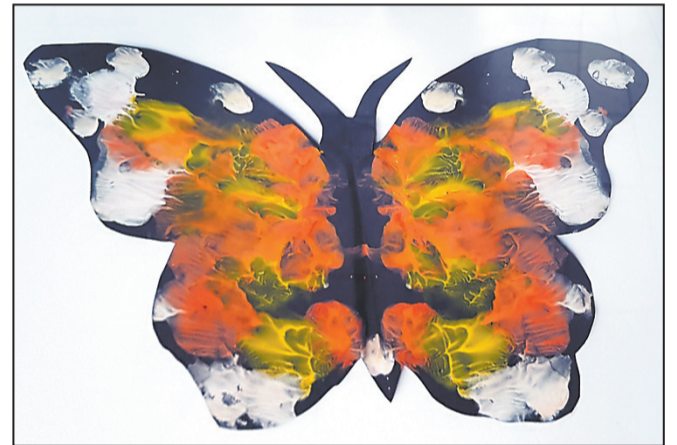
MOTÝL. Michal Švehla, 6 let, ZŠ Křížová, Jihlava