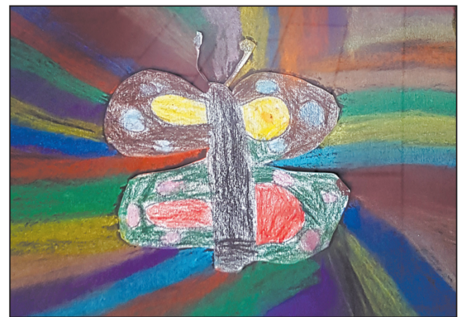
PROBUZENÝ MOTÝL. Vojtěch Bumbálek, 6 let, MŠ Seifertova, Jihlava

Více foto ve fotogalerii na www.jihlavske-listy.cz