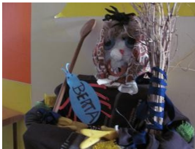
Čarodějnice 2. třída a 8. A

Čarodějnický týden se mi moc líbil. Dávali jsme se na pohádku O nosaté čarodějnici, vyráběli jsme čarodějnici, pavouky, chýši, čarodějnické koš-