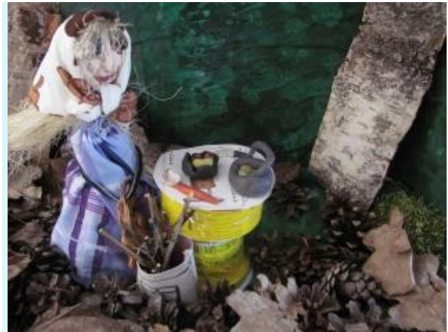
Domeček pro čarodějnici 1. třída, 7. A, 7. B

Společně s přípravnou třídou jsme vymýšleli názvy čajů. Dále jsme vymýšleli co všechno umí čarodějnické koště - létat, můžeme s ním zmizet, odletět na opačný konec světa, čarovat, pozná zlobivce, samo zame-