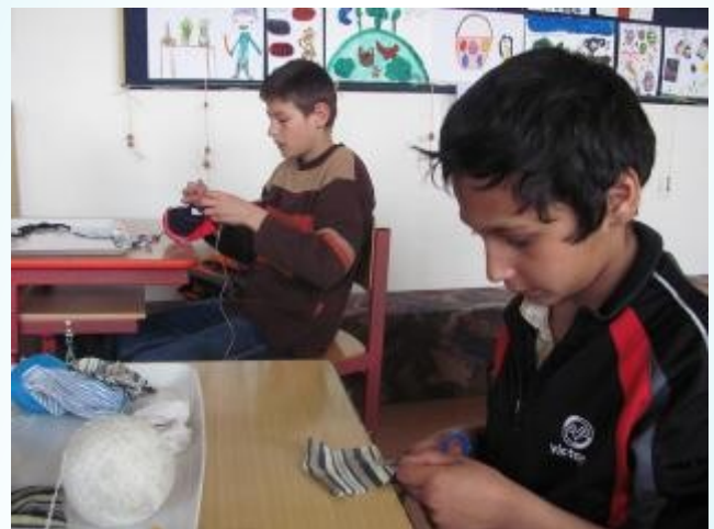
Domeček pro čarodějnici 1. třída, 7. A, 7. B

Takových týdnů jako ten čarodějnický by mohlo být ve škole víc . Nemuseli jsme se moc učit a bylo to bezva .Pomáhali jsme malým dětem vyrobit čarodějnici, vymyslet pro ní jméno ,vyrobit ten správný domek a koště pro čarodějnici .