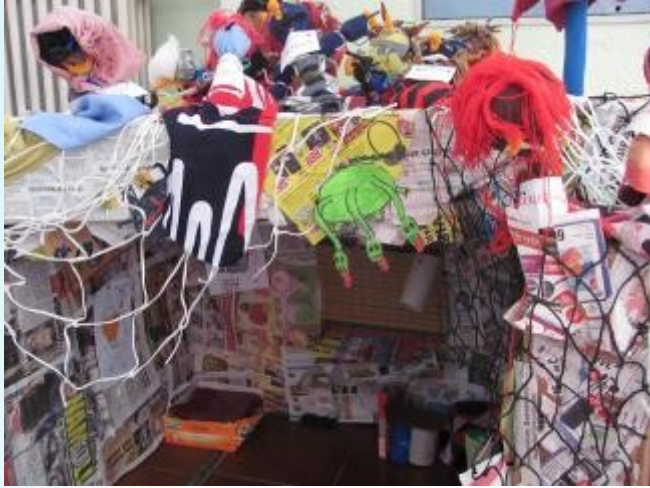
Domeček pro čarodějnici 4. třída, 9. třída

na školním hřišti . Ze všech akcí které třídy připravily , jsem si nejvíce užil ochutnávání čarodějnických lektvarů.