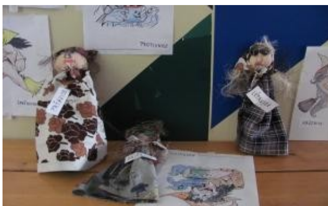
Čarodějnice 1. a 7. A, 7. B

Celý „Čarodějnický týden“ jsme pracovali spo-