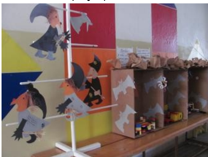
Čarodějny dům 2. třída, 8. A

Na konci „Čarodějnického týdne“ byla naše škola krásně vyzdobená úžasnými výrobky všech tříd. I rodiče se mohli přijít podívat, co všech-